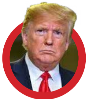
Donald Trump دونالد ترامپ