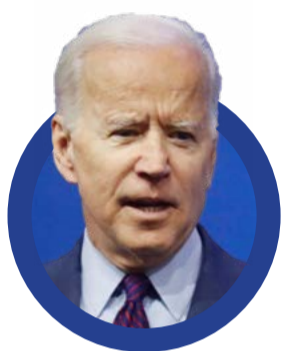
Joe Biden جو بایدن