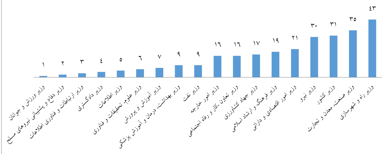
تعداد سؤالات نمایندگان مجلس نهم از وزرا از ۱۳۹۲/۶/۱ الی ۱۳۹۲/۹/۷

بررسی عملکرد مجلس طی سه ماهه اول اجلاسیه دوم (پایان دولت دهم) و سه ماهه دوم اجلاسیه دوم (آغاز دولت یازدهم) نشان می دهد که تعداد سؤالات نمایندگان از وزرای کابینه یازدهم بیش از ۵ برابر افزایش داشته است. ۱