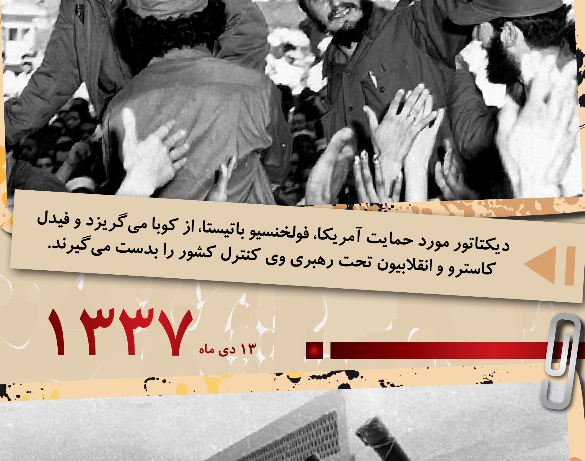
دیکتاتور مورد حمایت آمریکا، فولخنسیو باتیستا، از کوبا می‌گریزد و فیدل کاسترو و انقلابیون تحت رهبری وی کنترل کشور را بدست می‌گیرند.