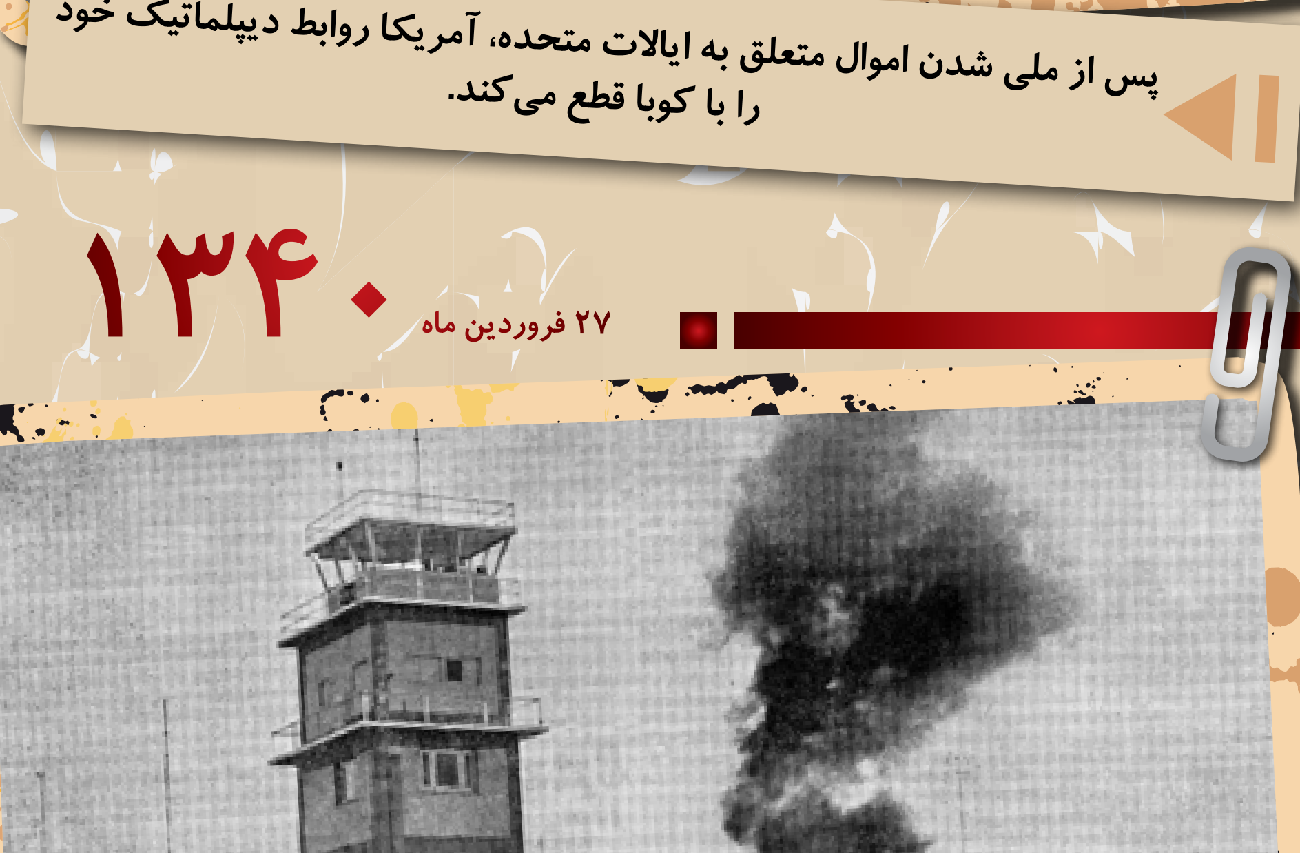
پس از ملی شدن اموال متعلق به ایالات متحده، آمریکا روابط دیپلماتیک خود را با کوبا قطع می‌کند.