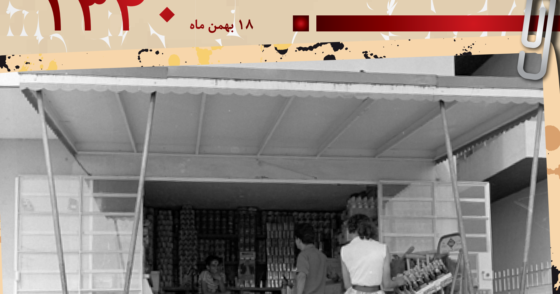
کاسترو انقلاب کوبا را سوسیالیستی می‌نامد. روز بعد، تبعیدیان کوبایی با بر خورداری از حمایت سازمان سیا در تلاشی نافرجام به کوبا در خلیج خوک حمله کردند.