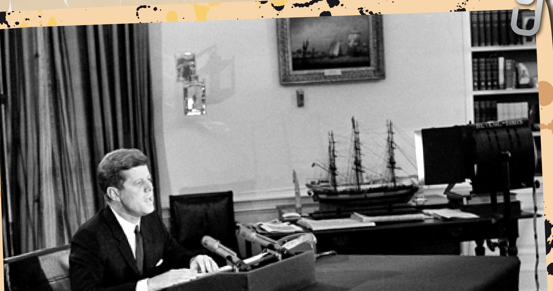
آمریکا تحریم‌های تجاری کاملی را به کوبا تحمیل می‌کند که تا پنجاه سال یعنی سال ۱۳۹۳، ادامه داشته است.