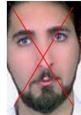
تمام صورت کاملاً مشخص نیست