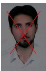
تصویر بسیار تاریک است