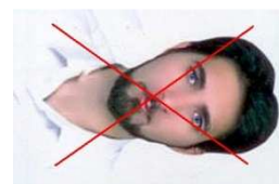
جهت تصویر نادرست است