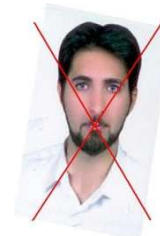
تصویر کاملاً صاف اسکن نشده است