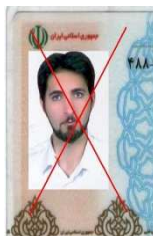
تصویر از روی یک کارت اسکن شده است