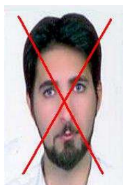
تصویر کشیده شده است