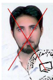
روی تصویر مهر خورده و مخدوش است