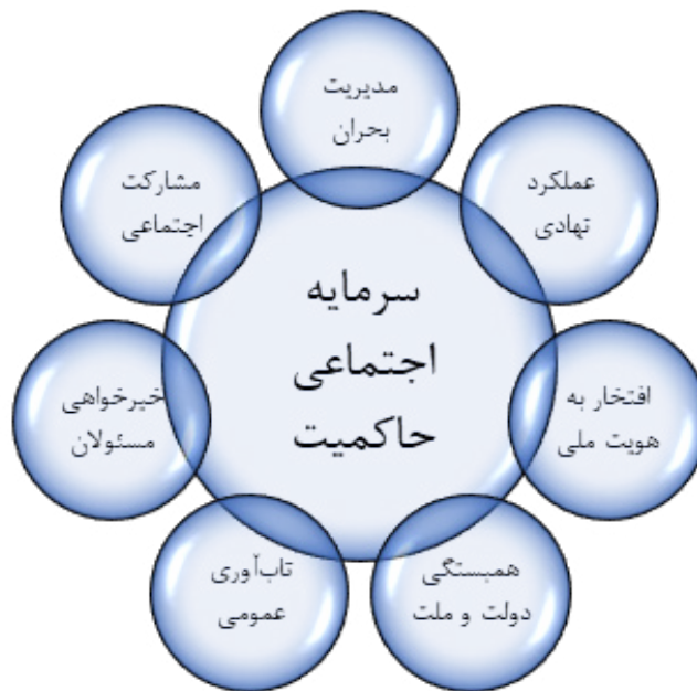
شکل ۱. اثرگذاری عملیات وعده صادق بر مؤلفه‌های سرمایه اجتماعی

نکات این گزارش را می‌توان در گزارشی تفصیلی با تحلیل‌های کمی و آماری در کنار تحلیل‌های تیپ‌شناسانه کیفی در آینده تقویت کرد. تا به اینجا اقدام جمهوری اسلامی در مقابله با رژیم صهیونیستی، از منظر سرمایه اجتماعی حاکمیت مثبت ارزیابی می‌شود. برای حفظ و ارتقای سرمایه اجتماعی می‌توان از چنین رخدادهایی بهره برده و در سایر کنش‌های سیاسی و اجتماعی این اصول را به کار بست. برخی راهبردها در این واقعه مشهود بوده و می‌تواند در حکمرانی مورد توجه قرار گیرد. بسیاری از سیاستگذاری‌های کلان و تصمیم‌گیری‌های مهم در صورتی که با پشتوانه و براساس خواسته مردمی باشد، دارای نتایج موفقیت‌آمیز خواهد بود. همان طوری که اگر در حوزه‌های حساسیت و مقاومت اجتماعی وجود داشته باشد، اصرار بر اقدام، ممکن است سرمایه اجتماعی را کاهش دهد. لذا مناسب است که پیش از ورود به ساحت اجرا، حاکمیت، ارزش‌های فراگیر را مورد توجه قرار دهد و در چارچوب این ارزش‌ها، سیاست‌ها و کنش خود را تنظیم کند. ارزش‌هایی که در بین اقشار مختلف فراگیری چندانی ندارند، نمی‌تواند تولیدکننده یا فزاینده سرمایه اجتماعی باشد. به‌عنوان نمونه، مشاهده شد که ترویج و تکیه بر عناصر هویت ملی می‌تواند در این زمینه مؤثر واقع شود. عملیات وعده صادق به ما نشان داد که می‌توان در زمان‌های حساس، استراتژی صبر راهبردی را در کنار پاسخ متقابل، مذاکره در عین حفظ اقتدار را با عقلانیت، اندازه‌نگری، توجه به خواسته‌های مشروع مردم و اخلاق اسلامی مدنظر قرار داد. رفتارهای هیجانی، سخنان احساسی، افراط و تفریط، وعده‌های بی‌سرانجام می‌تواند باعث کاهش سرمایه اجتماعی شود و لازم است در مدیریت بحران از این موارد اجتناب شود.