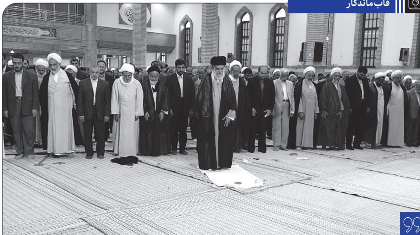
دیدار دست اندرکاران ستاد اقامه نماز با رهبر معظم انقلاب اسلامی بمناسبت صدور پیام به اجلاس سراسری نماز | ۱۳۸۵/۰۶/۲۷

توصیه به اتحاد و اتفاق که مخاطب آن همه‌ی دنیای اسلامند، در داخل کشور هم مخاطبان خودش را دارد. اتحاد و اتفاق را ملت عزیز ایران حفظ کنند. تا امروز آنچه به دست آورده‌اید، به برکت اتحاد و اتفاق به دست آورده‌اید. اتحاد و اتفاق معنایش این نیست که همه دارای یک سلیقه و یک مذاق باشند؛ اتحاد و اتفاق این است که سلیقه‌های گوناگون در کنار هم بنشینند، دست در دست هم بدهند، منافع ملی را بر احواء شخصی مقدم بدانند، خودخواهیها را وارد عرصه‌های گوناگون سیاسی و اجتماعی و تعاملات گوناگون نکنند. ۱۳۸۷/۰۷/۱۰ بیانات در خطبه‌های نماز عید سعید فطر